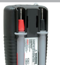
Test prod holder