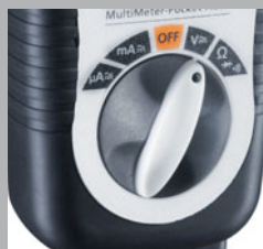
Easy-to-use rotary function knob