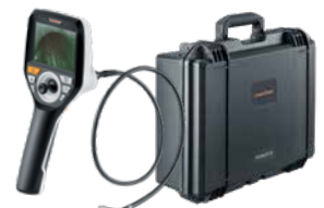
VideoInspector 3D inkl. Transportkuffert