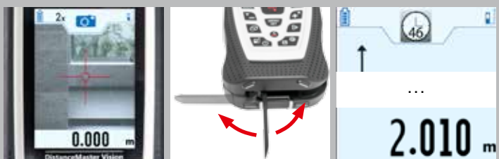
kamera til at præcis måling

Emballeringsdimension (W x H x D) 155 x 265 x 81 mm